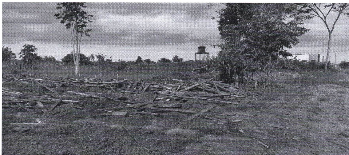
Figura 1 - Imóvel de estudo

Imóvel Urbano, constituído do lote nº 07 da Quadra nº 269, Setor Sul, com 60,00m de frente e fundo, 90,00m de laterais, perímetro de 300,00 m, área total de 5.400 m 2 (Cinco mil e quatrocentos metros quadrados), Localizado na Travessa Getúlio Vargas, S/N, Alto Pará, na cidade de Placas, Estado do Pará, com o seguintes limites e confrontações: Frente: com rua 21; Fundos: com a rua 23; Lado direito: Lote 09 e 13-B da mesma quadra; Lado Esquerdo: Lote 05 e 19 da mesma quadra, com as Seguintes coordenadas geográficas; Latitude: 03°52'38.27" e Longitude: 54°12'51.98".